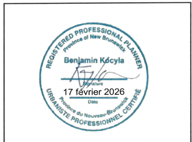
Sceau de l'urbaniste professionnel certifié