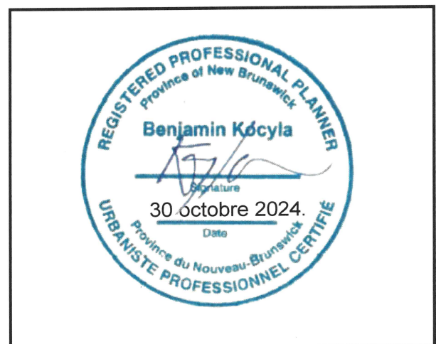
Sceau de l'urbaniste professionnel certifié